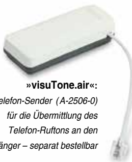
»visuTone.air«: Funk-Telefon-Sender (A-2506-0) für die Übermittlung des Telefon-Ruftons an den Empfänger – separat bestellbar

Das Programm umfasst zwei Systeme, »visuTone« und »visuTone.air«. Die jeweiligen Sets enthalten alle erforderlichen Komponenten. So ist Ihre Lichtklingel mit wenigen Handgriffen betriebsbereit.